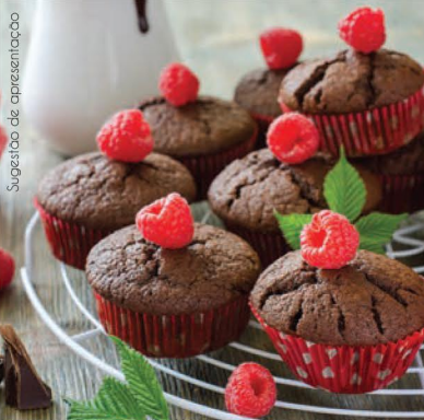
Sugestão de apresentação

Mix rico em vitaminas e minerais que ajudam no normal funcionamento dos sistemas imunitário e nervoso. Contribuem também para o normal funcionamento do coração e dos músculos, e para a manutenção de ossos normais.